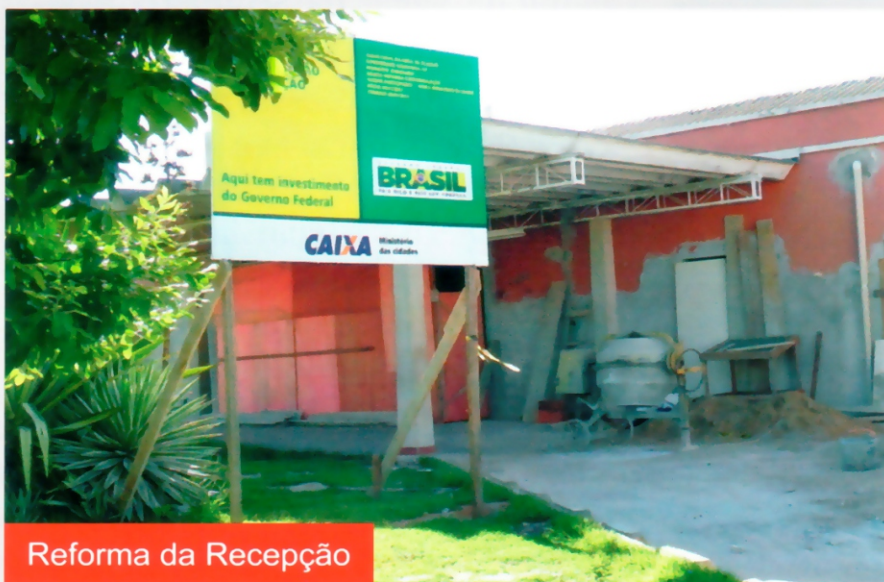
Reforma da Recepção